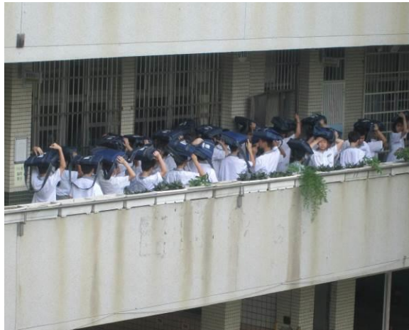
地點：教室走廊 時間：104年3月20日 說明：（人員疏散至操場）