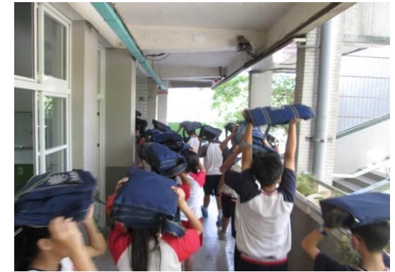
9 月預演演練照片 3