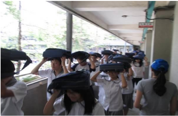
9 月預演演練照片 1