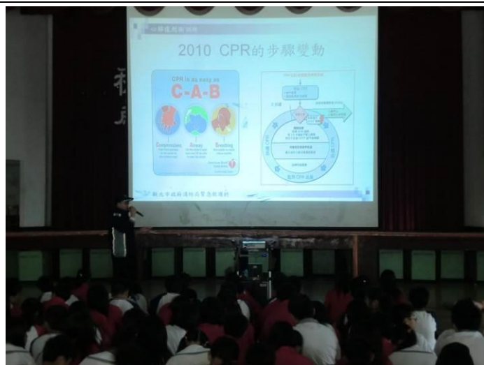
與（國光分隊消防局）共同辦理