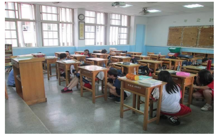
地點：忠勤樓教室 時間：104年3月20日 說明：地震！地震！全校師生請立即就地避難掩護！（二）保護頭部及身體，躲在桌下時，以雙手緊握住桌腳。（三）開門、關燈。