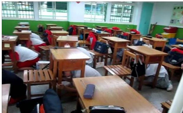
9 月正式演練照片 1