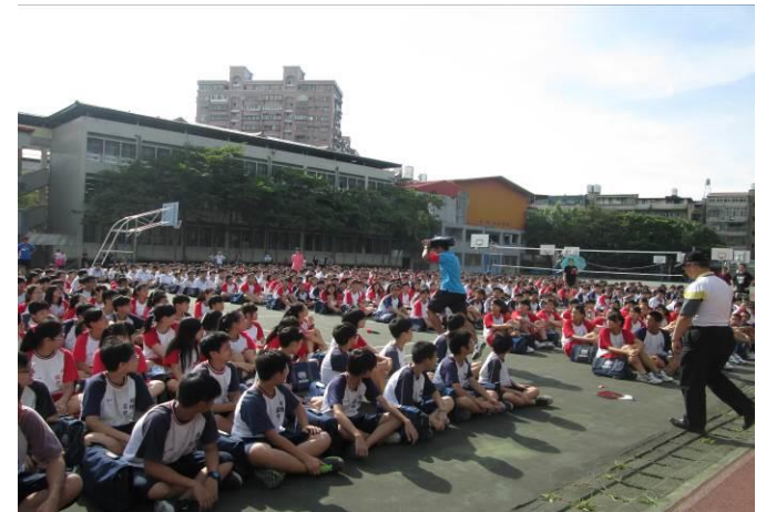
地點：大操場 時間：104年3月20日 說明：（人員疏散至操場）