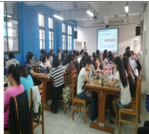
地點：大會議室 時間：104年8月28日 說明：104學年度教職員工CPR&AED講座