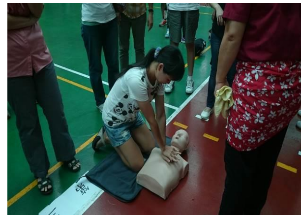
地點：風雨操場 時間：104年8月28日 說明：104學年度教職員工CPR分組進行實地操作演練