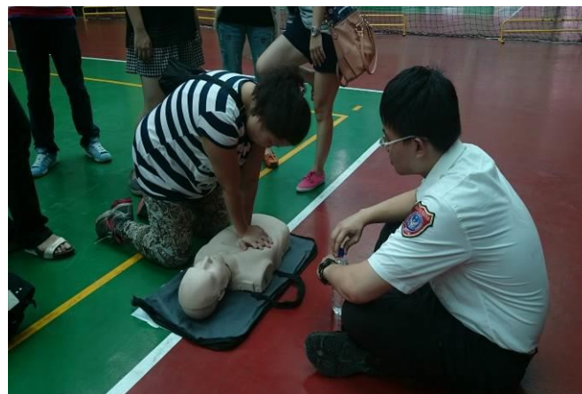
地點：風雨操場 時間：104年8月28日 說明：104學年度教職員工CPR分組進行實地操作演練