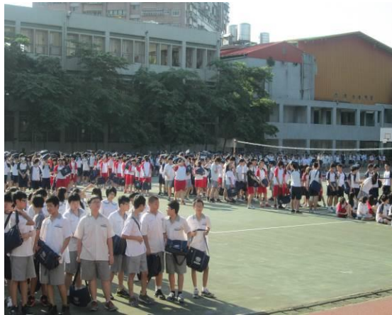
地點：大操場 時間：104年3月20日 說明：（人員疏散至操場）