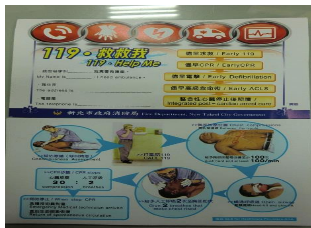
地點：活動中心 時間：104年4月24日 說明：藉由急救小卡引起動機