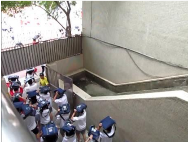
9 月正式演練照片 3