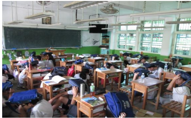
9 月預演演練照片 2