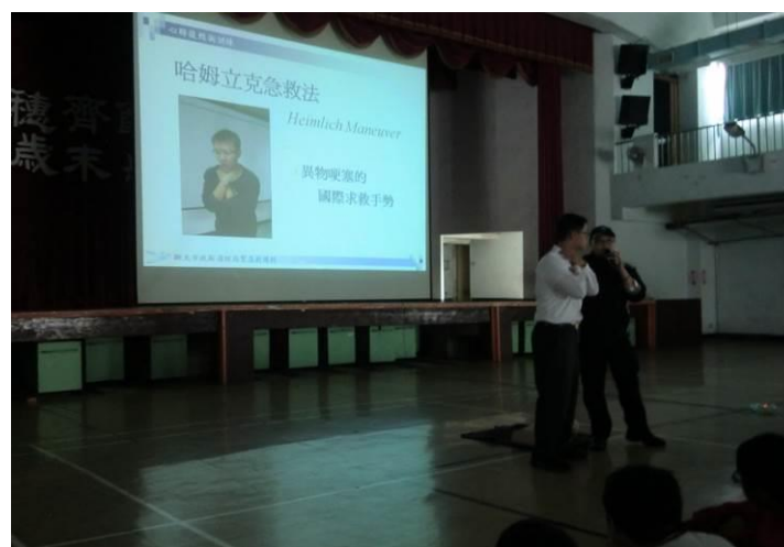
與（國光分隊消防局）共同辦理