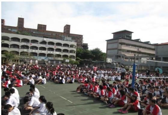
9 月預演演練照片 4