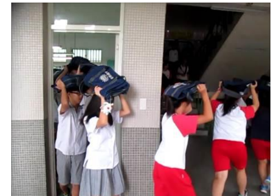
9 月正式演練照片 2