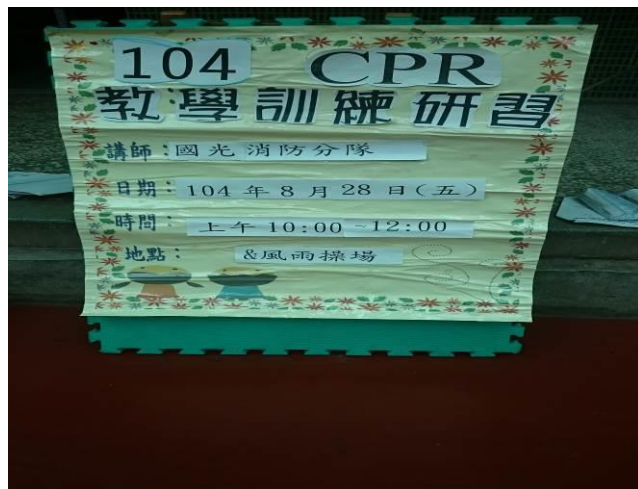
地點：大會議室 時間：104年8月28日 說明：104學年度教職員工CPR&AED講座