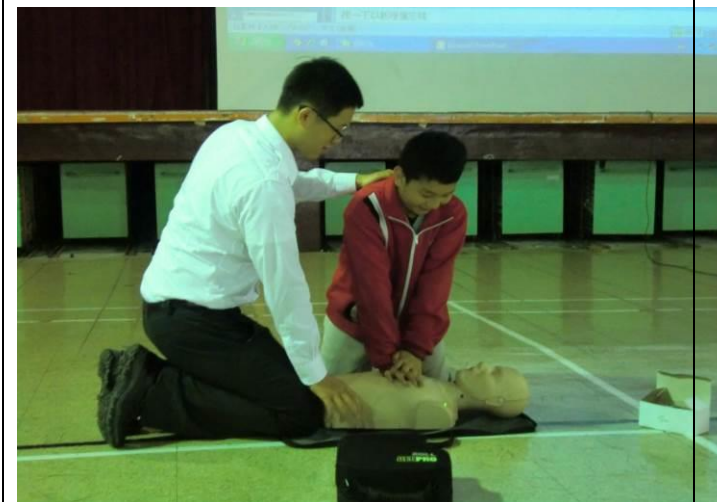
與（國光分隊消防局）共同辦理