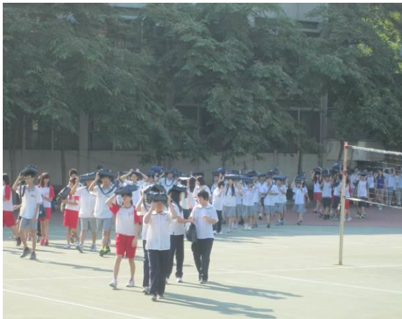
地點：大操場 時間：104年3月20日 說明：（人員疏散至操場）