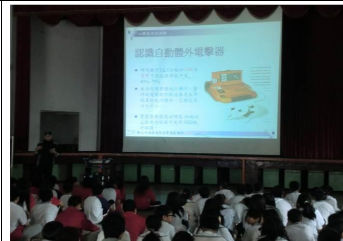
地點：活動中心 時間：104年4月24日 說明：認識AED-自動體外電擊器