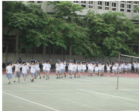
地點：大操場 時間：104年3月20日 說明：（人員疏散至操場）