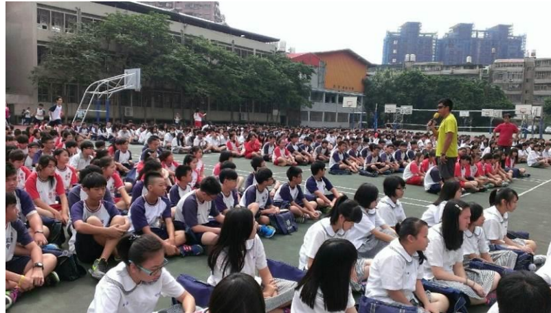
9 月正式演練照片 4