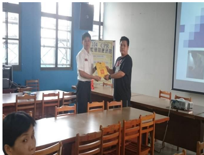
地點：大會議室 時間：104年8月28日 說明：104學年度教職員工CPR&AED講座